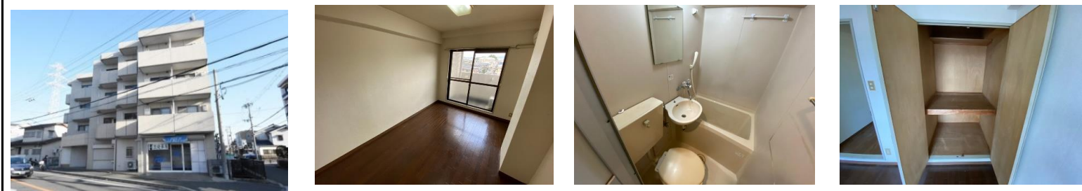
トロント80外観 内装写真 ユニットバス 収納