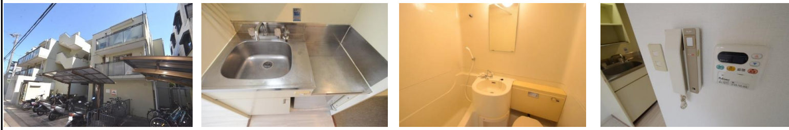
ダイドームゾン甲東園外観