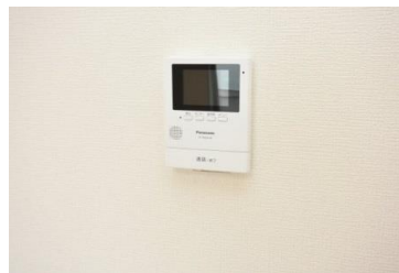
モニター付きインターホン