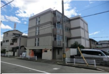
ロイヤルメゾン塚口Ⅷ外観