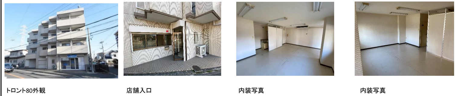
トロント80外観 店舗入口 内装写真 内装写真