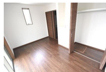
洋室&クローゼット