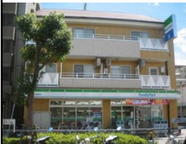
猪名寺ツーワンビル外観