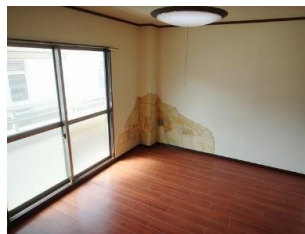
アクセントクロス