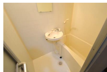
2点セパレートバスルーム