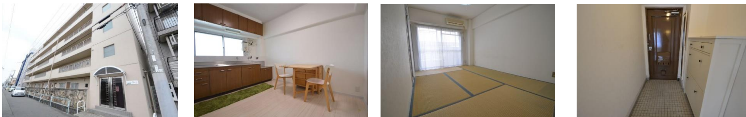
マンションラージ外観