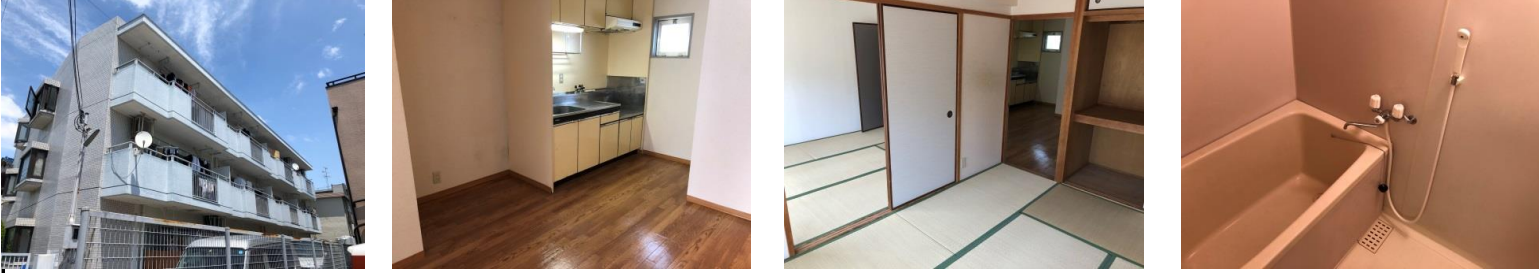
ファーストプレイス園田外観 ダイニングキッチン 和室 浴室